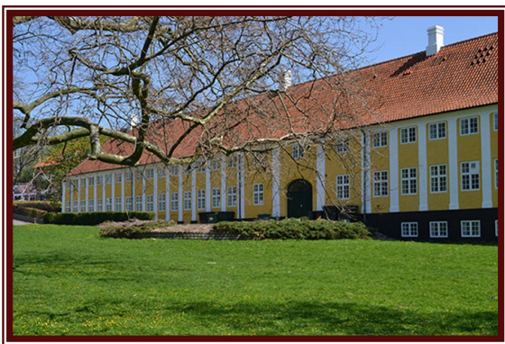
Kaalund Klosters hovedbygning i dag, set fra haven.